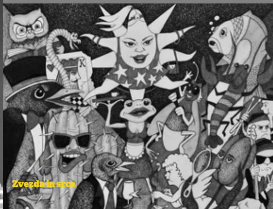
Zvezda in srce

Nedelja, 17. september 2023, ob 17.00 Sunday, 17 September 2023, at 5.00 pm